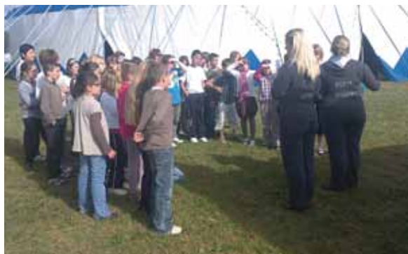
Les élèves attentifs découvrent l'envers du décor