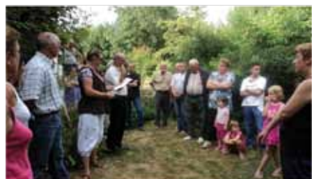
Rencontres au village 2010 Le moulin Pont Pajaud à Sainte Cécile

L' Office de Tourisme du Pays des Essarts renoue cette année avec ses rendez-vous de l'été, devenus incontournables. La population locale comme les touristes pourront ainsi à nouveau profiter de la richesse des Rencontres au village, qui se dérouleront chaque lundi soir à 19h.