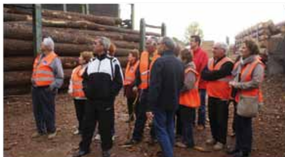
Visite de la scierie Piveteau à Sainte Florence

E n octobre 2010, 8 entreprises du Pays des Essarts ont ouvert leurs portes dans le cadre de l'opération régionale "Visitez nos entreprises en Pays de Loire".