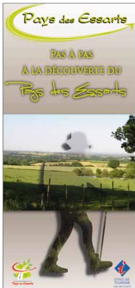
Le nouveau guide rando

Un nouveau guide rando vient de paraître et est disponible à l'Office de Tourisme. Pour 4 €, découvrez ou redécouvrez les 150 kilomètres de sentiers de randonnée ainsi que les différents équipements récemment installés.