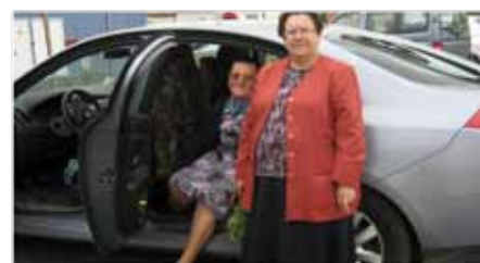
Un service très apprécié des usagers