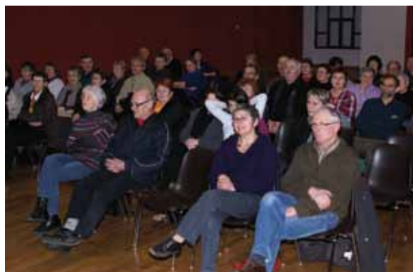
Découverte de la Bulgarie à Saint Martin-des-Noyers

L' Office de Tourisme du Pays des Essarts a renoué en début d'année avec ses soirées « Carnets