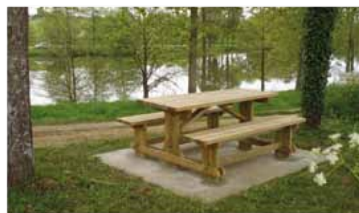
L'étang de la Haute-Rivière à L'Oie

Sur le guide rando, retrouvez également le tracé du sentier équestre et de l'itinéraire cyclable reliant La Roche-sur-Yon à La Châtaigneraie. Traversant notre territoire sur plus de 45 kilomètres, la Communauté de Communes a participé à la création de cet itinéraire à hauteur de 120 700 €.