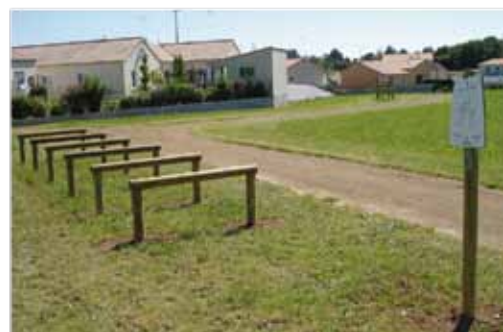
Le parcours de santé à L'Oie