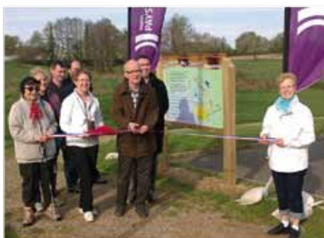
Inauguration du sentier des Oiseaux

Pour les plus jeunes, des livrets pédagogiques permettent de progresser sur ces deux sentiers au rythme des jeux et devinettes. Une façon ludique de découvrir la nature. Ils sont disponibles à l'Office de Tourisme, à la Communauté de Communes, et dans les mairies concernées. Ils sont également téléchargeables sur leur site Internet.