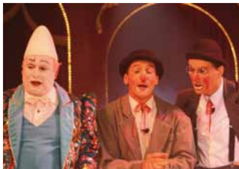
Les clowns ont conclu le spectacle dans la bonne humeur