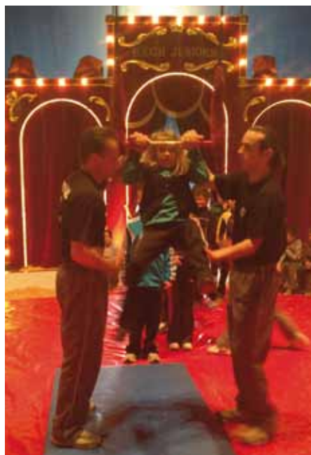
Apprentissage du trapèze

Cette soirée a conclu de fort belle manière la semaine des Arts du Cirque, programme mené par le Conseil Général de la Vendée en collaboration avec la Communauté de Communes, au cours duquel les élèves des écoles du canton des Essarts ont pu s'initier aux disciplines du cirque mais aussi découvrir le mode de vie des artistes.