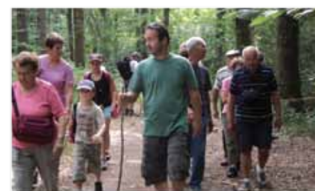
Balades estivales 2010 à Saint Martin-des-Noyers

tuels, en été, au Pays des Essarts : les Balades estivales, qui ont lieu chaque mercredi matin, à partir de 9h30. Le principe est d'organiser une randonnée guidée, de 6 à 7 km, à la découverte de chacune des communes du territoire. Les Balades estivales se dérouleront les 20 et 27 juillet, et 3 et 10 août, sur les communes de L'Oie, Sainte Cécile, Boulogne et Les Essarts.