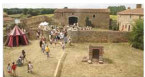
1 ère Journée médiévale en 2009

Moyen-Age, notamment à travers des ateliers de forge, travail du cuir, maille, herboristerie ou cuisine. D'impressionnantes démonstrations de combat seront également au programme.